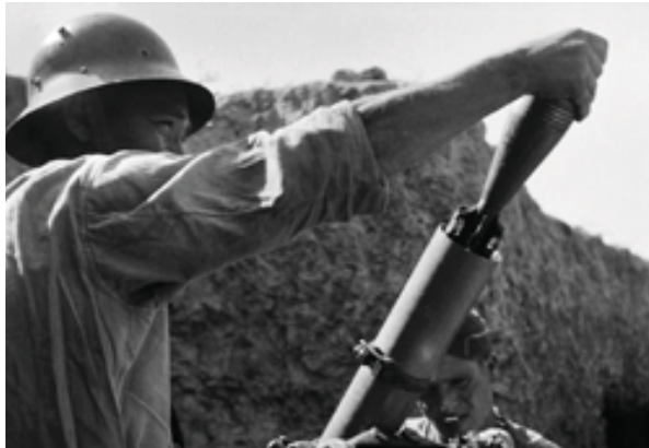
Dos soldats republicans carreguen un morter.