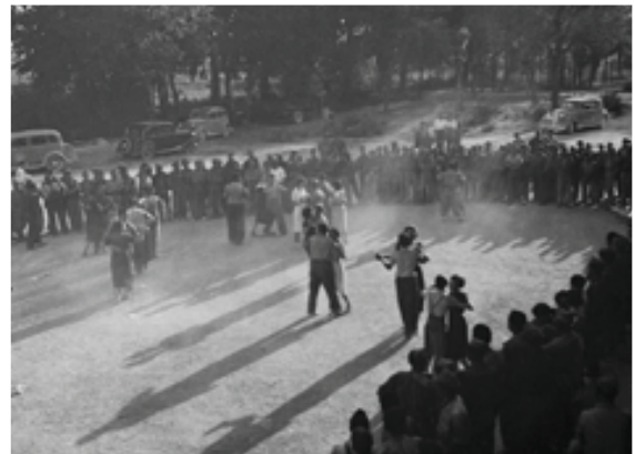
Ball al Castell de Remei amb dones de l'Aliança Nacional de la Dona Jove.