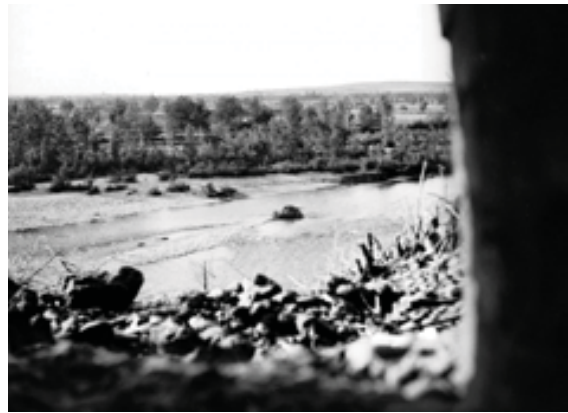
L'agost de 1938, un tanc intenta tornar a les posicions republicanes durant la crescuda del riu Segre causada per l'obertura dels embassaments, en mans dels feixistes.