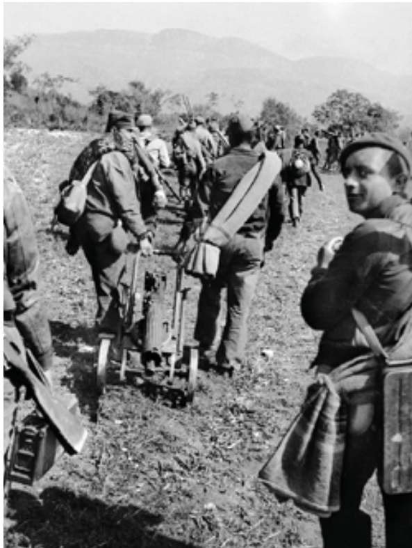
Soldats a la vall de Meià.