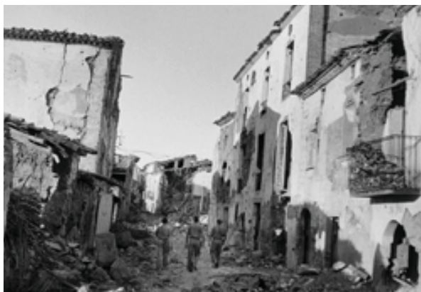
Vilanova de la Barca l'agost de 1938.