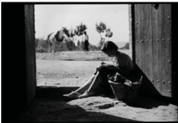
En diverses ocasions, Boix va retratar civils amb els quals va conviure.

I ja per acabar, una anècdota final que lliga un jove del passat amb els joves del present. Algunes entitats que reben l'exposició organitzen visites adreçades als estudiants dels darrers cursos de secundària. Durant una conversa, la directora d'una d'aquestes entitats indicava la impressió que als joves els causava saber que les fotos que veien havien estat fetes per un noi que tenia, aproximadament, la seva edat. L'apatia vital (i generalment, per sort, transitòria) que en alguns casos els acompanyava es transformava en sorpresa i empatia i era evident que la formació de la imatge de si mateixos en les circumstàncies que tenien davant dels ulls removia alguna cosa dins seu.