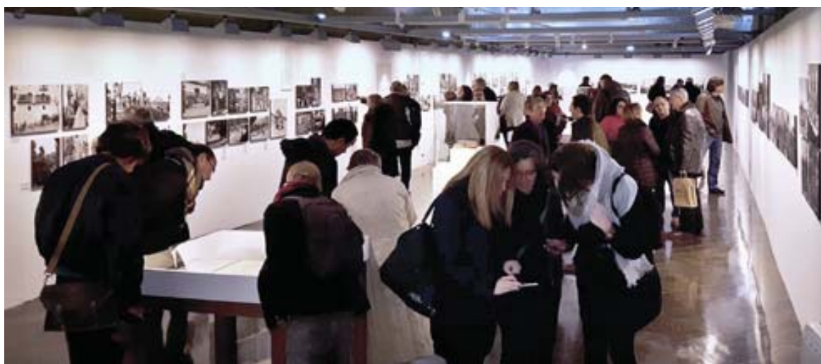
Figura 3. L'exposició «Els primers trets de Francesc Boix» a la Sala Montsuar de Lleida..