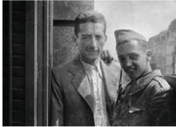
Gregorio López Raimundo i Francesc Boix en un balcó de l'Hotel Colón de Barcelona, seu de les JSU durant part de la Guerra Civil.