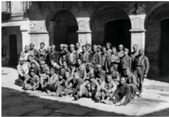
Retrat a la plaça de Vilanova de Meià, del grup de soldats que ha participat en unes operacions militars a la zona del barranc de Badaüll, al Montsec de Rúbies.