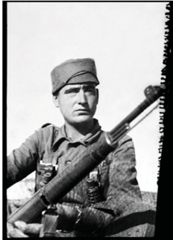
Soldat de l'Exèrcit Popular de la República.