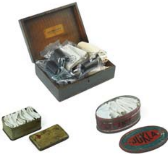
Figura 1. Els negatius dels dos productors van arribar en dues capsas de llauna, que contenien les fotografies d'abans de la Guerra Civil, i una de fusta, amb els de Francesc Boix.

cionat amb una dedicació considerable. Pel que fa als negatius de la Guerra Civil, eren dins d'una capsa de fusta i a l'interior de la tapa hi havia una etiqueta amb l'anotació «Aliança Nacional de la Dona Jove. Als nostres combatents». Hi havia dos tipus de negatius, de 35 mm (nitrats de pel·lícula de cinema aprofitada pel fotògraf) i de 3 × 4 cm (format 127), tots també embolcallats amb paper amb anotacions manuscrites.