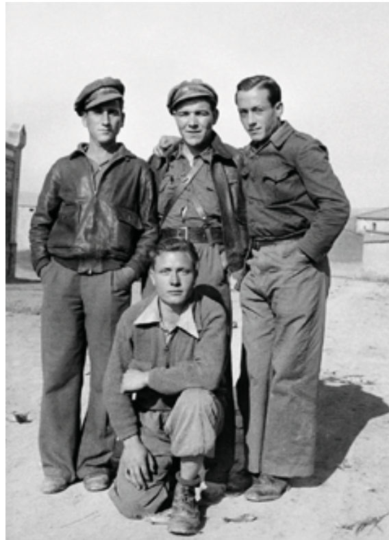
Soldats de l'Exèrcit Popular de la República.