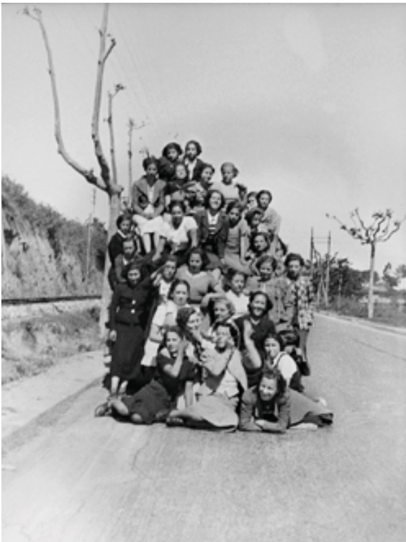
Grup de dones de l'Aliança Nacional de la Dona Jove durant una visita als soldats de la 30a Divisió.