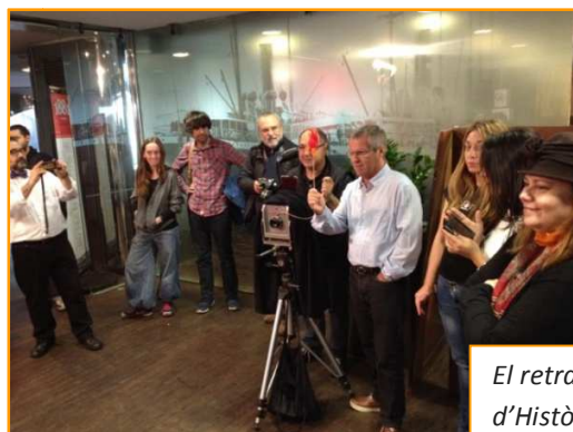
El retratista ambulante al Museu d'Història de Catalunya el 8 de novembre.