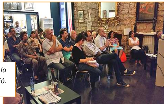
Fototertúlia del 6 d'octubre de 2014, dia de la celebració del 3er aniversari de Fotoconnexió.

Història de l'associació Saint Victor i de la fotografia al barri barceloní.